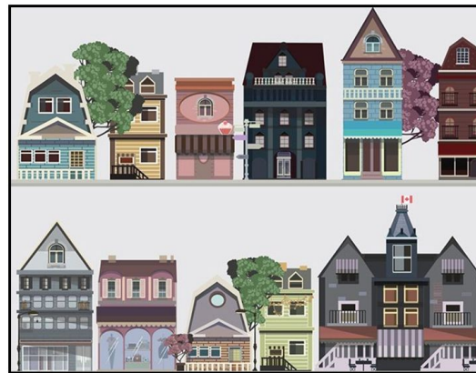
5.att. Plānotais ielas izskats.