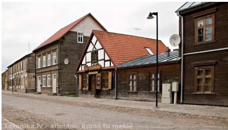
4.att. Jelgavas iela.

Jelgavas centrā ir vairākas ielas, kurās saglabājušās vecās koka ēkas. Skat. 4. att. Iedvesmojoties no Jelgavas vecpilsētas ielām, nolēmu tās atdarināt, izveidojot ielu ar vairākām koka ēkām. Skat. 5. att.