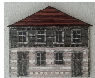
13.att. 14. att. Māju izveide.