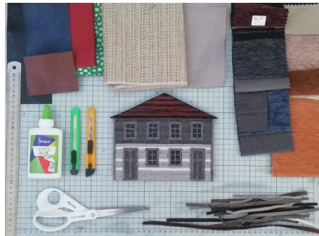
10.att. Izvēlētie darba materiāli.