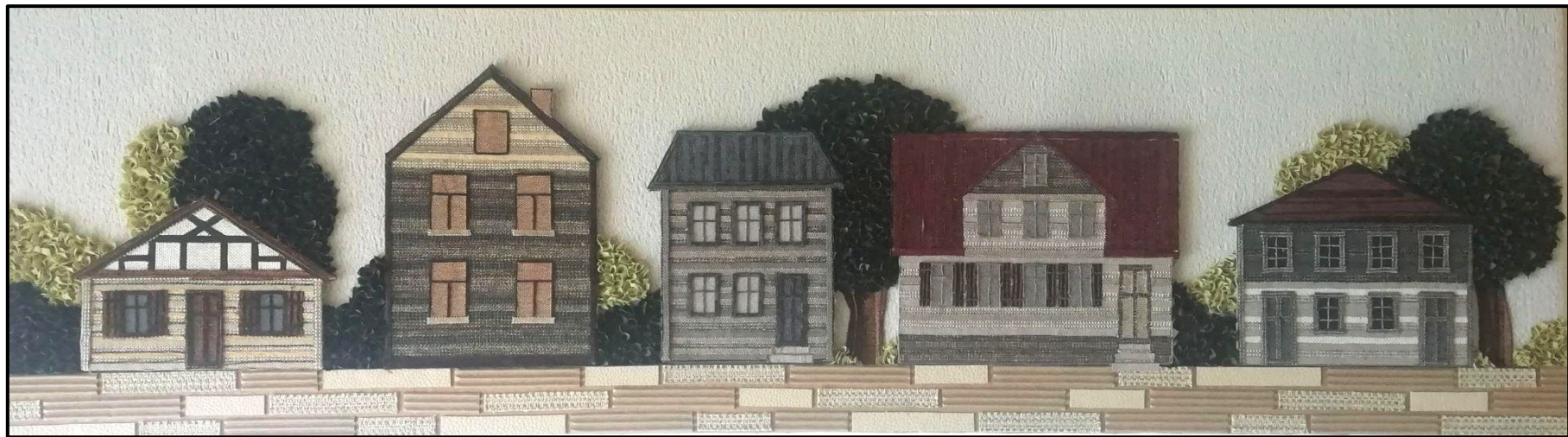
17.att. Noslēguma darbs.