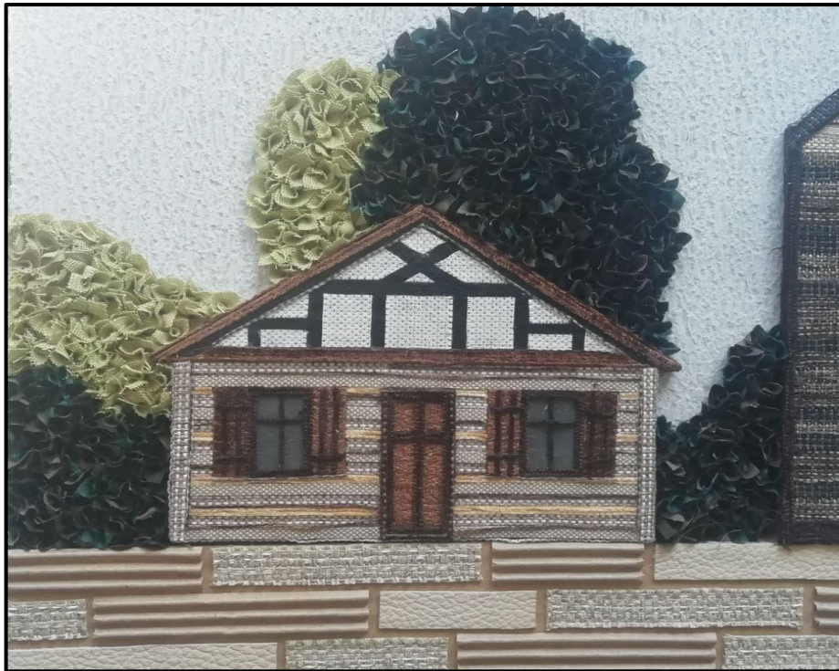
18.att. Darba fragments.