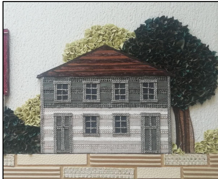
21.-22.att. Darba fragmenti.