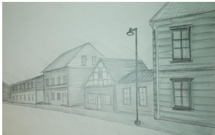
6.att. Jelgavas iela.

Koka ēku paraugus un piemērus meklēju internetā un skolotāju iedotajos materiālos. Izvēlejos piecas ēkas, kas man visvairāk iepatikās. Skat. 7 - 8. att.