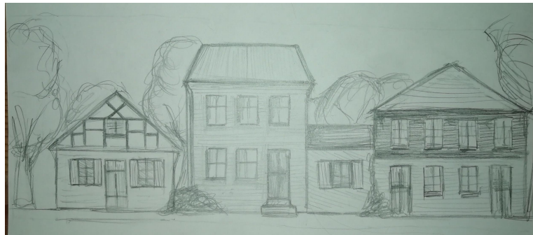
9.att. Ielas skice.

Darbā izmantoju: audumus, mākslīgo ādu, kartonu, putuplastu, PVA līmi.