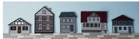
15.att. Ceļa izveide.