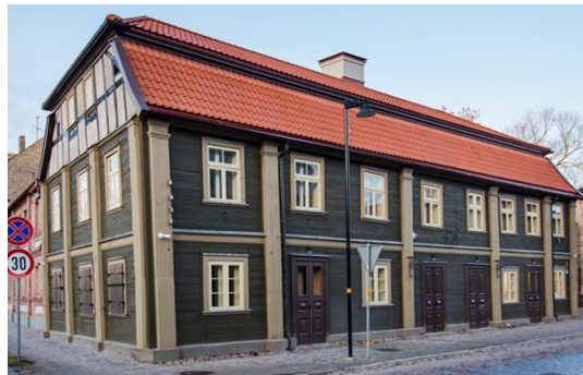
2.att. Jelgava, Vecpilsētas iela 14.