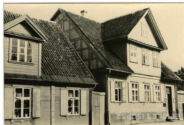
7.att., 8.att. Divas no mājām, ko attēloju.