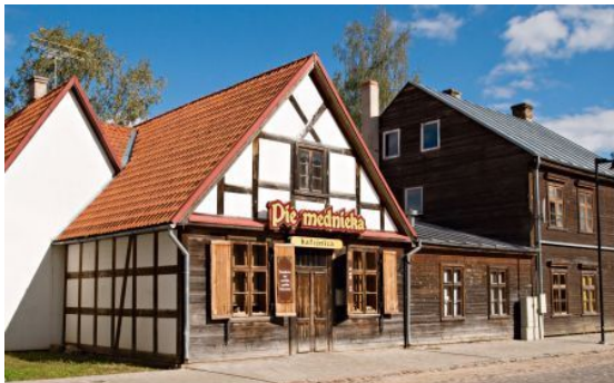
1.att. Kafejnīca "Pie mednieka."

Lai arī daudzas no šīm ēkām mūsdienās vairs neeksistē, es vēlejos parādīt, ka tās vienmēr būs iespēja apskatīt caur fotogrāfijām un šāda veida darbiem. Skat 3. att.