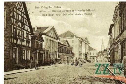
3.att. Vecpilsētas iela.