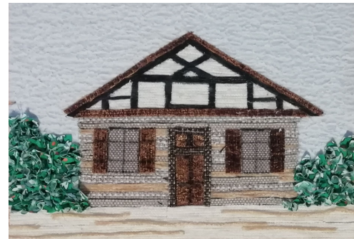
11.att. Mājas paraugs.