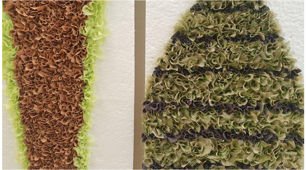
Faktūra no auduma