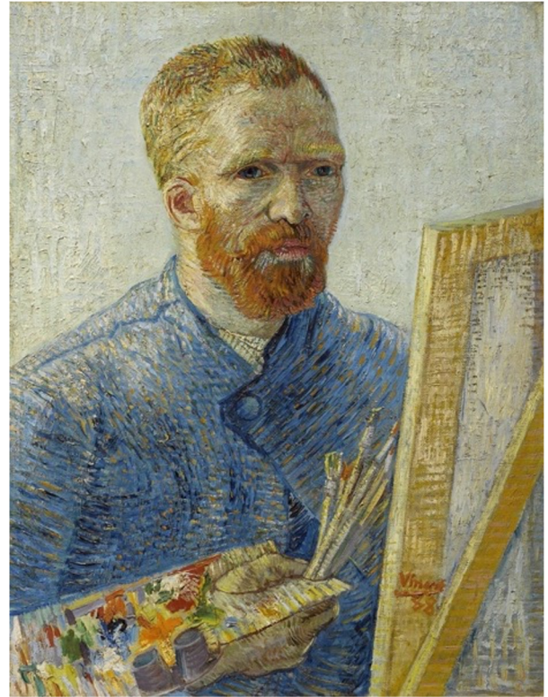
Self-Portrait as a Painter- Vincents Van Gogs

Šī glezna līdzinās manai, abās attēlots pašportrets, kurā notiek darbība- gleznošana. Glezna atšķirās ar to, ka piemērs attēlo vienu cilvēku un tas gleznots impresionisma stilā. Manā gleznā, es centos panākt reālismu.