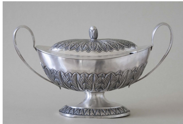
Rundāles pils eksponāts