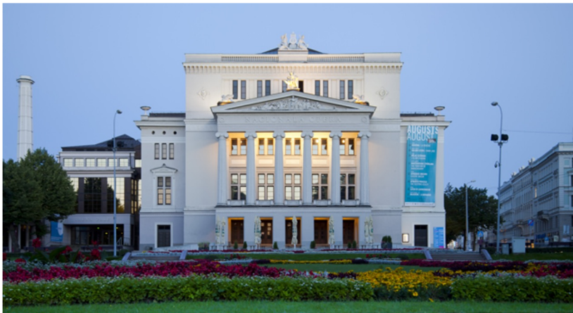
Latvijas Nacionālās operas un baleta ēka

Latvijā vieni no spilgtākajiem klasicisma piemēriem ir Nacionālās operas un baleta ēka, kā arī daļa baroka stilā celtās Rundāles pils ekspozīcijas. Tāpat mūsdienās iekštelpu interjeros ir ne pārāk bieži, bet regulāri sastopamas atjaunotas klasicisma stila mēbeles, kas tiek veiksmīgi pielāgotas izvēlētajam interjera stilam.