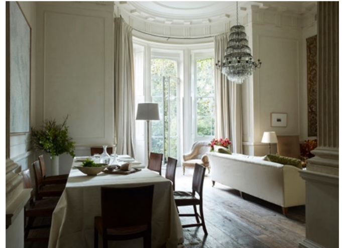
Londona, 21. gs.