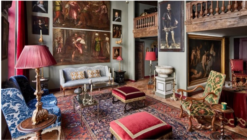
Parīze, 17. gs.

Savukārt pasaulē par mākslas klasicisma Meku kopš šī stila pirmsākumiem uzskata Franciju, kas gan nav klasicisma dzimtene, bet pasaules vēsturē nozīmīga tās attīstītāja. Tieši Francijas ietekmē klasicisms izplatījās Anglijā, Holandē, Vācijā un citur Eiropā.