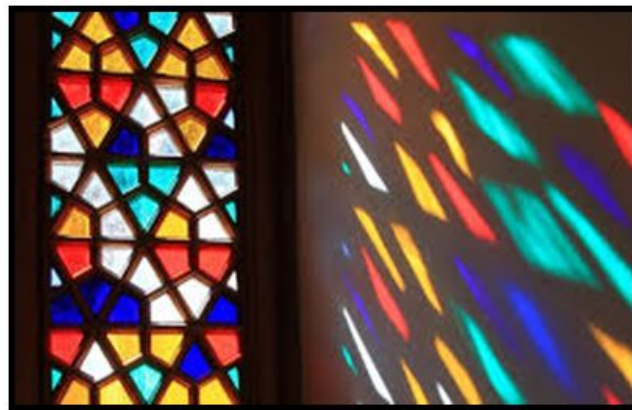
2.att. Vitrāžas gaismas spēle.