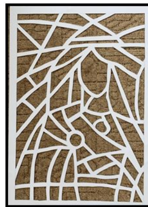
9.att. ceturtais darba solis.