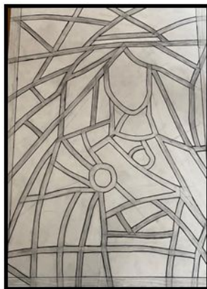
8.att. Trešais darba solis.