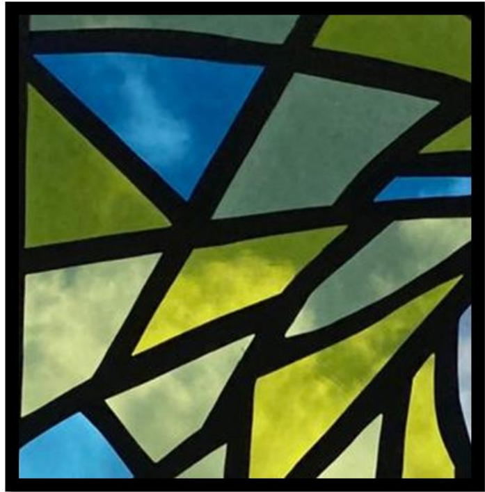
11.att. Noslēguma darba fragments.