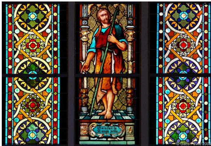
1.att.Sv. Jāņa baznīca Vecrīgā, vitrāžas detaļa.

• Vēlējos izveidot vitrāžu, kā privātmājas loga un telpas dekoru. Radīt gaismas spēli un krāšņu interjera elementu. Skat. 2.att.