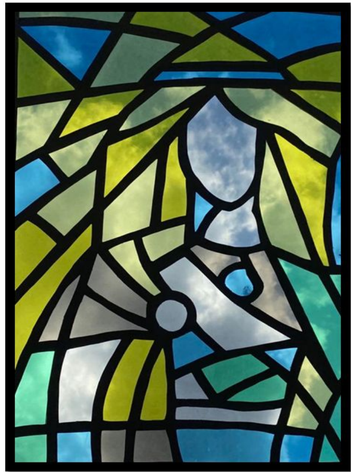
12. att. Mans noslēguma darbs.