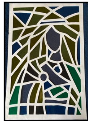
10.att. Piektais darba solis.