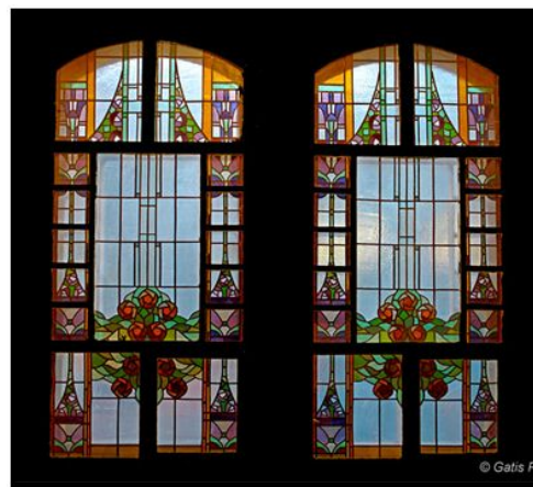
3.att. Baznīcas iela 5, kāpņu telpas logs otrajā stāvā.

•Skatoties interneta avotos, bija dažādas pamācības par vitrāžu veidošanu. Tās bija ļoti sarežģītas, tāpēc uz klausīju un sekoju skolotājas piemēriem un padomiem.