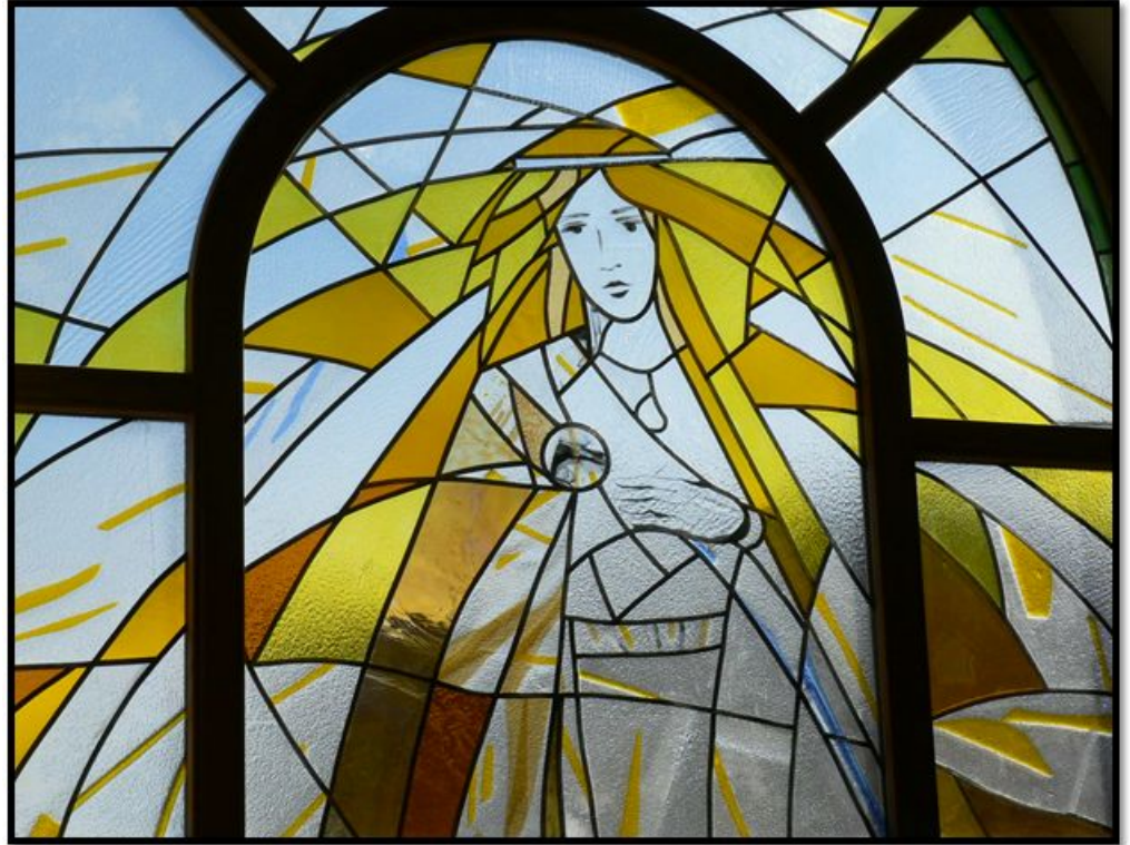
5. att. Jelgavas Sv. Trīsvienības baznīcas tornā vitrāža.