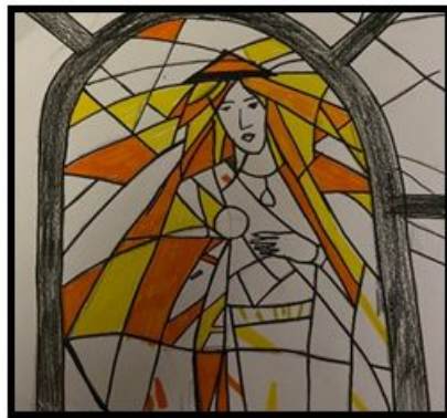
6. att. Pirmais darba solis.

• Pielīmējot visus gabaliņus, es salīmēju abas lapas kopā. Skat. 10.att.